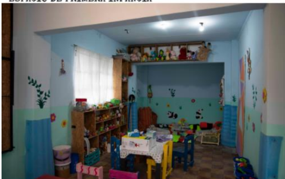
ESPACIO DE PRIMERA INFANCIA